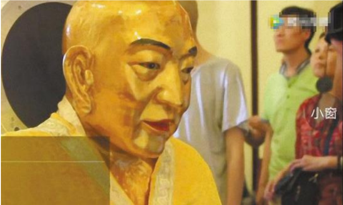
“千年高僧”被重复塑的金身。